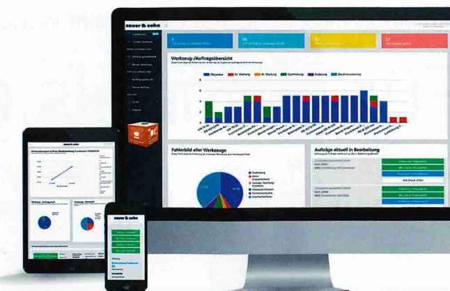
Die TSM Plattform bietet Vernetzung und Kollaboration über die gesamte Wertschöpfungskette.

Die TSM-Plattform geht jedoch über die reine Dokumentation hinaus. Aus der Dokumentation eines jeden Auftrags wird automatisch ein Analysecockpit mit Daten gespeist, das die Werkzeughistorie mittels verschiedener Diagramme aufbereitet abbildet. Aus diesen Diagrammen lassen sich die Werkzeugperformance, Fehlerbilder sowie wiederkehrende Fehler ablesen. Darauf aufbauend können die einzelnen Werkzeuge optimiert werden, um Werkzeugausfälle durch sich wiederholende Fehler zu verhindern. So kann der War-